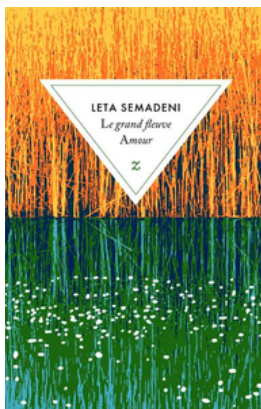
Leta Semadeni Le grand fleuve amour Zulma, 2025

Gravement malade, Edith a choisi de se faire euthanasier en Suisse, dans la ville de Bâle. Ses quatre enfants et son mari l'accompagnent vers sa dernière destination et racontent la manière dont ils traversent cette épreuve, entre leur volonté d'offrir d'ultimes moments de joie et leur détresse face à la perte irréductible de celle qu'ils aiment.