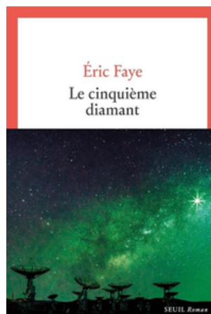
Eric Faye Le cinquième diamant Seuil, 2025

Joséphine, une jeune fille participant à un voyage scolaire dans un zoo à quelques jours de Noël, se retrouve au centre de cette visite qui vire à la catastrophe. Alors que toute la vérité sur l'affaire n'est pas claire, ses parents mènent l'enquête.