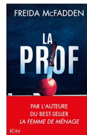
Freida McFadden La prof City, 2025

Alors que règne un climat de guerre froide, des missiles nucléaires russes sont victimes d'une attaque venue du ciel. La CIA comme la Maison-Blanche s'inquiètent car la frappe n'émane pas de l'armée américaine. Dans le même temps, Janet et Mike, un couple d'astrophysiciens, repèrent un objet intersidéral entré dans le Système solaire, dont la nature déclenche une polémique parmi les scientifiques.