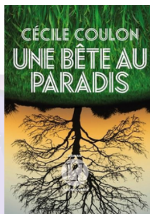
Cécile Coulon Une bête au paradis L'Iconoclaste, 2019

Eve est une professeure de mathématiques qui mène une vie de rêve auprès de son mari Nate. Mais le lycée au sein duquel elle travaille est secoué depuis un an par un scandale. En effet, un enseignant aurait eu une liaison avec Addie, une élève. Mais Eve soupçonne cette dernière de mentir, et Addie a de lourds secrets qu'elle compte bien garder.