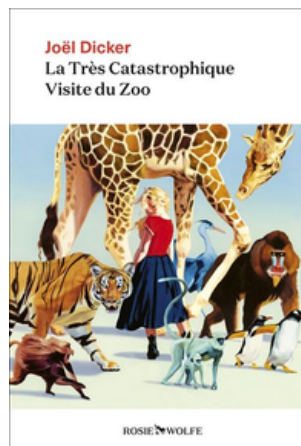
Joël Dicker La très catastrophique visite du zoo Rosie & Wolfe, 2025

Joséphine, une jeune fille participant à un voyage scolaire dans un zoo à quelques jours de Noël, se retrouve au centre de cette visite qui vire à la catastrophe. Alors que toute la vérité sur l'affaire n'est pas claire, ses parents mènent l'enquête.