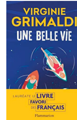
Virginie Grimaldi Une belle vie Flammarion, 2023