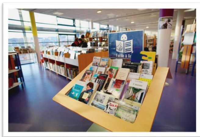
Fonds Facile à lire, médiathèque de Landerneau