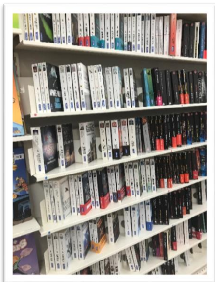
Présentation en grande surface