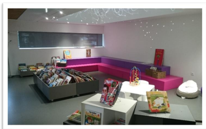
Médiathèque de Le Cellier (44)

Enfin, dans l'espace jeunesse, un espace qui puisse accueillir des animations de type contes, lectures, spectacles petites formes et servir pour l'accueil du public le reste du temps sera prévu.