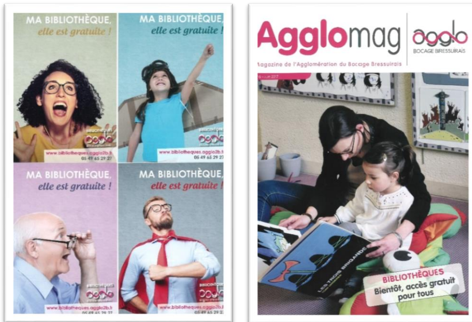
Campagne de communication 2017 pour la promotion de la gratuité de l'inscription

La mise en marche du système intégré de gestion des bibliothèques (SIGB) et du site internet a été accompagnée de l'instauration de la gratuité de l'inscription sur tout le réseau, aussi bien pour les habitants du territoire que pour les extérieurs.