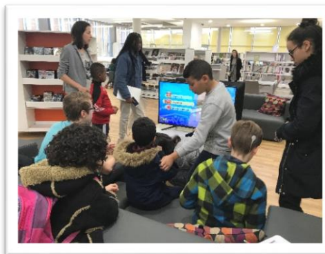
Bibliothèque de Lyon 3e

La présence d'une ludothèque à Nueil-Les-Aubiers (16km) permettrait d'envisager un travail en partenariat avec ce service, le musée et le CSC du Mauléonais.