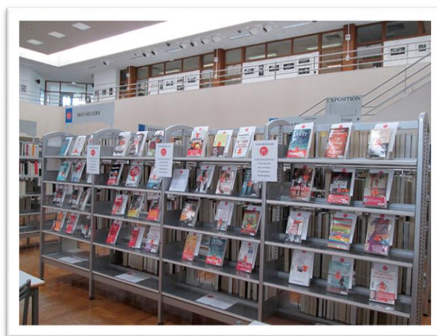
Fonds « best-seller » médiathèque de Saint-Etienne