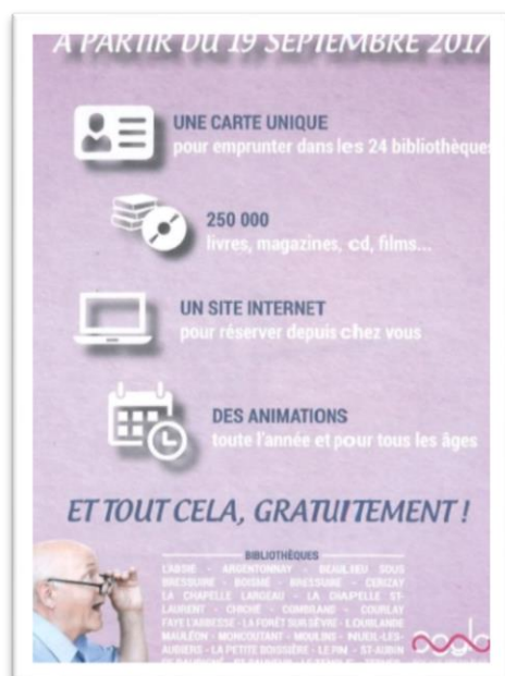
Campagne de promotion 2017

La campagne de communication qui a accompagné la gratuité a été primordiale et a largement contribué à la réussite de l'opération. Aussi cet aspect ne doit pas être négligé lors du projet. Il est donc prévu un travail avec le service communication afin de promouvoir ce projet puis le service.